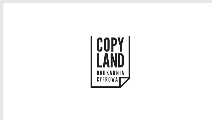
str. 4 lakier UV rewers

Plik w formacie .pdf, .jpg, .tiff, .png, cdr.