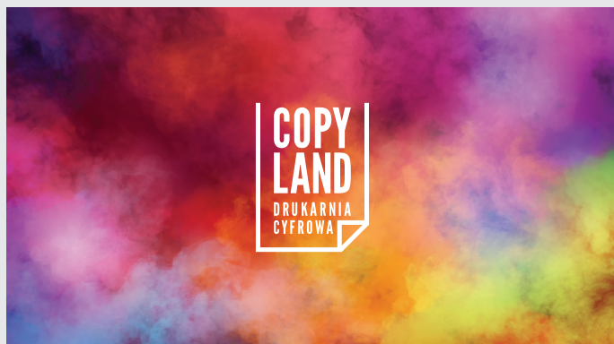
str. 2 druk CMYK rewers